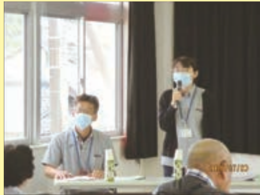
講師 公益社団法人 宮崎市郡医師会

もし、自分や家族が 病気やケガをし、 改善が期待できない状態 になった時、 どんな療養生活を 希望しますか？