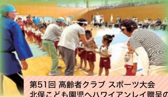
第51回 高齢者クラブ スポーツ大会 北俣こども園児へハワイアンレイ贈呈の様子