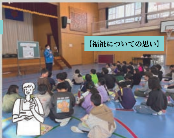
【福祉についての思い】

実際に体験することで、日常生活での不便さや、周囲の支えの大切さを実感することができた子供達です。