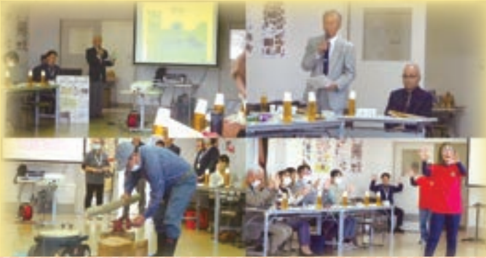
県市町村ボランティア連絡協議会県央ブロック研修会