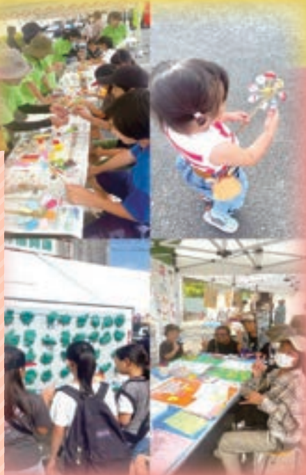
第13回 ボランティアまつり