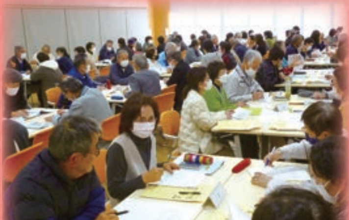
民生・児童委員並びに高齢者世帯訪問員合同研修会 グループトークの様子