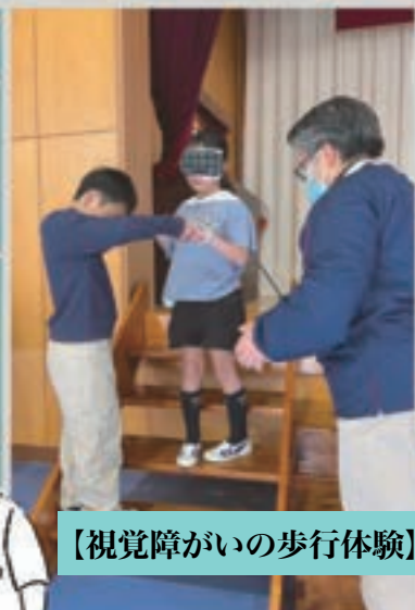
【視覚障がいの歩行体験】