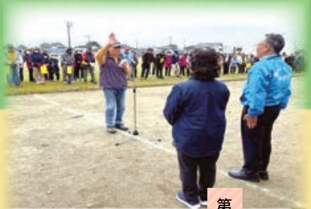
第63回 グラウンド・ゴルフ大会